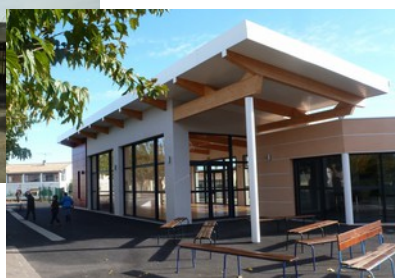
École des Muriers