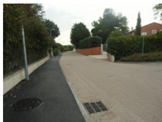
Rue des Bousigues