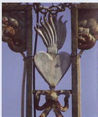
Croix de mission