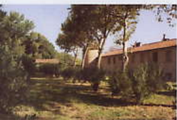
Domaine de Peyrat