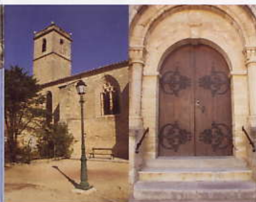
Église Saint Martin